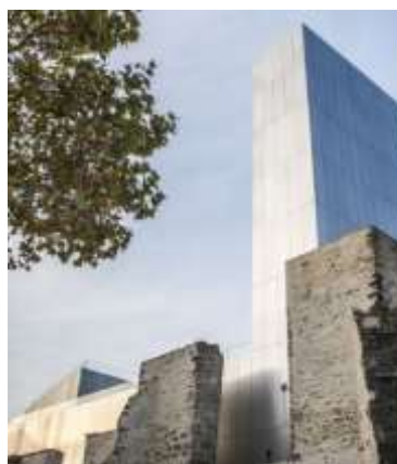
Couvent des Jacobins Poli-brillant