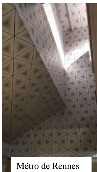
Métro de Rennes