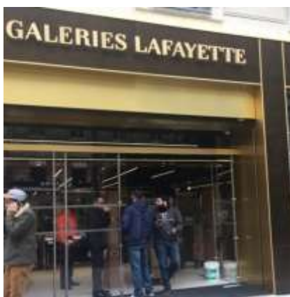
Galeries Lafayette : Or Poli miroir