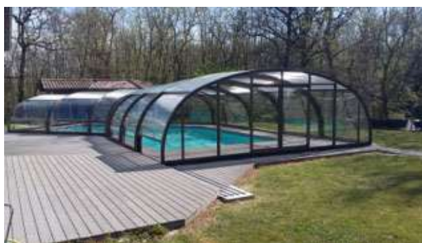
Abri de piscine

ANOLAQ Chalumeau – 3 rue Pierre Maitre – 37270 Montlouis sur Loire Tél : 02 47 45 03 46 http://www.anolaq.fr