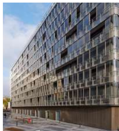
Gare d'Auteuil Sablé-bronze